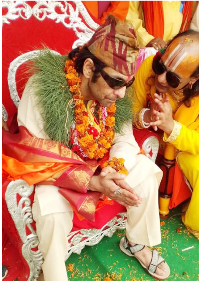
दैनिक समाचारदाता राजविराज, १९ चैत । पूर्व युवराज पारसलाई

सप्तरीमा राजावादी तथा हिन्दुवादी धार्मिक संघ संगठनले स्वागत र अभिनन्दन गरेका छन् ।